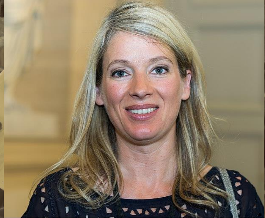
B. Abba, actuelle secrétaire d'Etat à la biodiversité