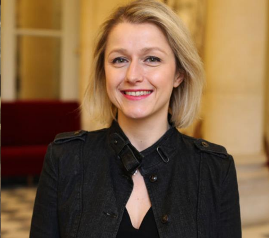
B. Pompili : ancienne secrétaire d'Etat à la biodiversité sous Ségolène Royal, ministre de la transition écologique