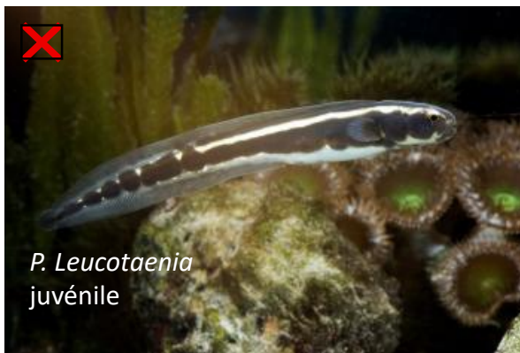
P. Leucotaenia juvénile

Confusion possible avec les juvéniles de Pholidichthys leucotaenia mais la présence des barbillons les différencie. Aucune espèce semblable en Méditerranée