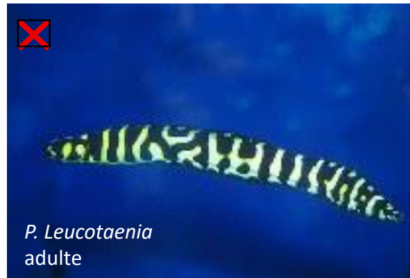
P. Leucotaenia adulte