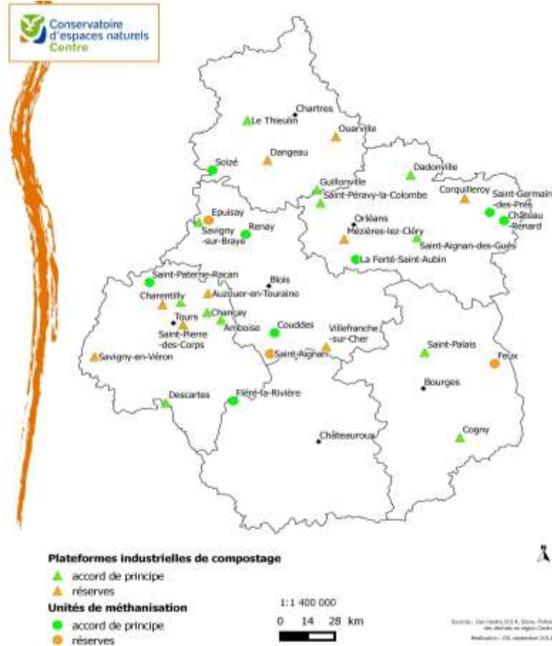
Figure 2: centres de traitement susceptibles de recevoir des déchets de plantes invasives en région Centre-Val de Loire

Quarante-six structures industrielles ont pu être recensées en région Centre-Val de Loire : trente-deux plateformes de compostage et quatorze unités de méthanisation. Quarante de ces structures ont été contactées et donc sensibilisées à la problématique des plantes invasives. Vingt ont donné leur accord de principe pour traiter les plantes invasives et douze présentent des réserves.