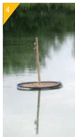
© BOLUE Estudios ambientales ingurumen ilerketak