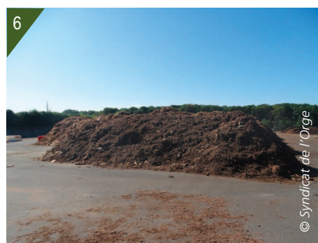
4 - Dépôt des déchets de renouée. 5 et 6 - Broyage et mise en andains.