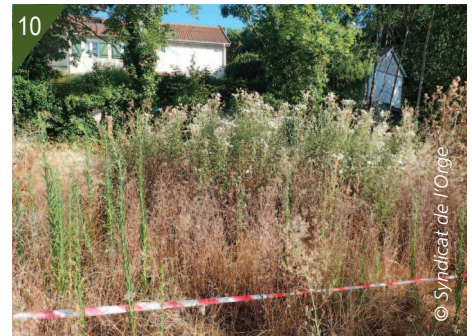
9 - Évolution de la placette avec compost non mélangé à la terre. 10 - Évolution de la placette avec compost mélangé à la terre.