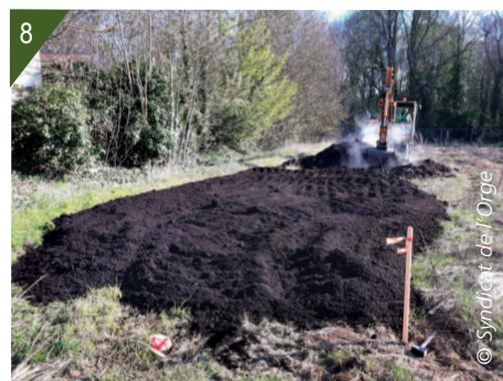
Épandage du compost de renouées. 7 - Compost étalé à même le sol. 8 - Compost intégré à la terre.