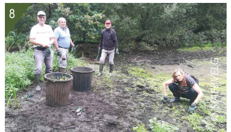
4 - Tapis formé par la colonisation de la Crassule de Helms. 5 - Colonisation du marais par la Crassule de Helms. 6 - Repérage visuel avant arrachage. 7 - Arrachage manuel de la Crassule de Helms. 8 - Stockage temporaire des déchets de crassule issus de l'opération.