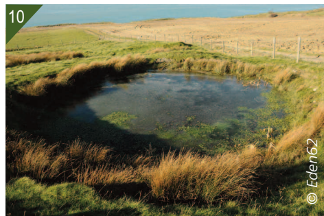
9 et 10- Mares colonisée à nouveau par la Crassule de Helms, en janvier 2016.