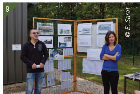
8 et 9- Actions de sensibilisation réalisées sur le terrain.