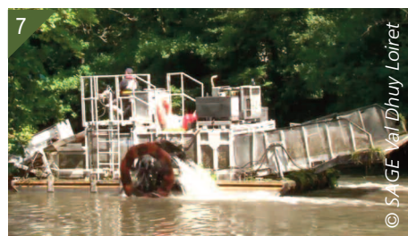
7- Bateau faucardeur moissonneur.