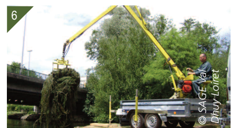
3 et 4- Râteau hydraulique motorisé (Ratodo). 5- Plantes chargées sur une barge ostrécicole. 6. Mini-grue pour décharger les plantes dans une benne (plucker).