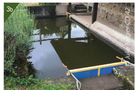
2 - a, b et c. Localisation de la population de crassule sur l'étang en 2014 (en rouge). 3 - a et b. Filtres installés au niveau du fossé (a) et du lavoir (b).