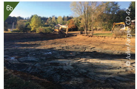
4 - Plan d'eau en cours de vidange.