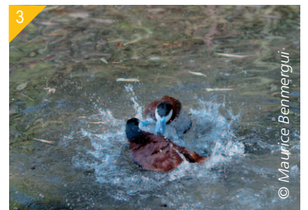
1- Mâle d'Érismature rousse en plumage nuptial. 2- Femelle d'Érismature rousse. 3- Mâles agressifs pendant la période de reproduction.