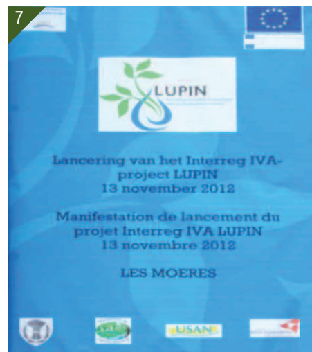
6- Ramassage manuel après intervention. 7- Présentation du projet Lupin.