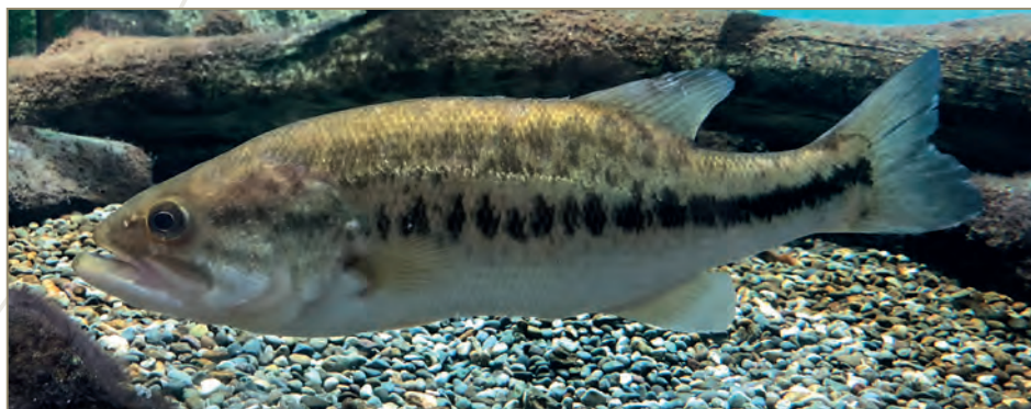
Centrarchidae ; Micropterus salmoides – Achigan à grande bouche, Black-bass, perche d'Amérique, perche noire, perche truitee