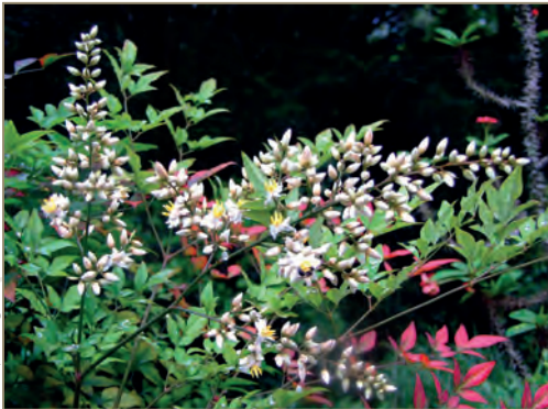
Ilex aquifolium – Houx