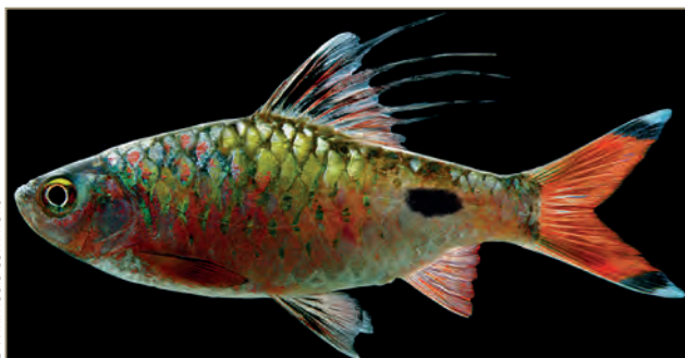
Dawkinsia spp. ; Dawkinsia filamentosa – Barbu à tache noire