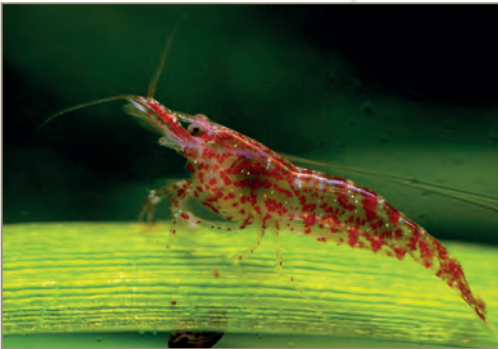
Caridina ; Caridina multidentata – Crevette Japonica