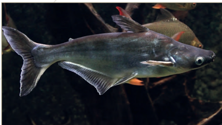
Pangasiidae ; Pangasianodon hypophthalmus – Panga