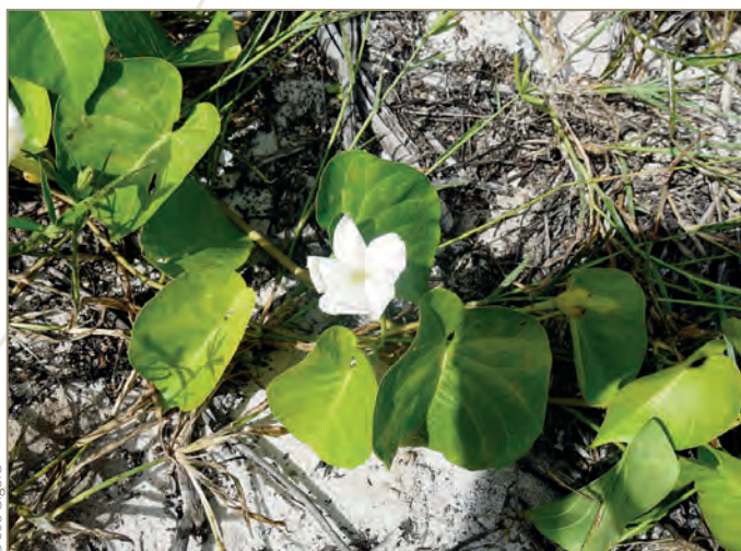
Houttuynia cordata – Plante caméléon