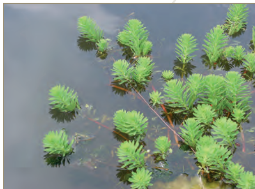
Cabomba caroliniana – Cabomba ou éventail de Caroline