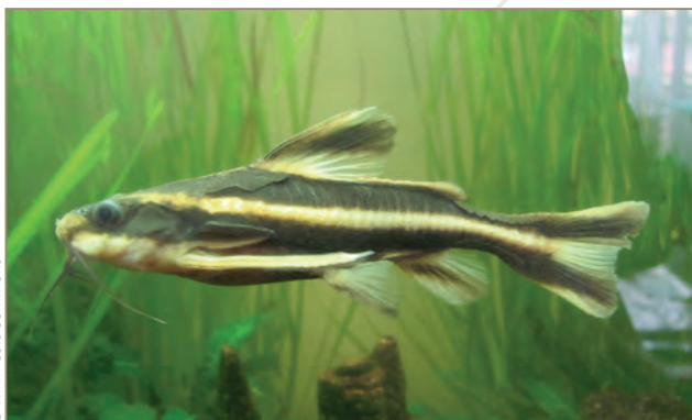
Doradidae ; Platydoras costatus – Silure rayé