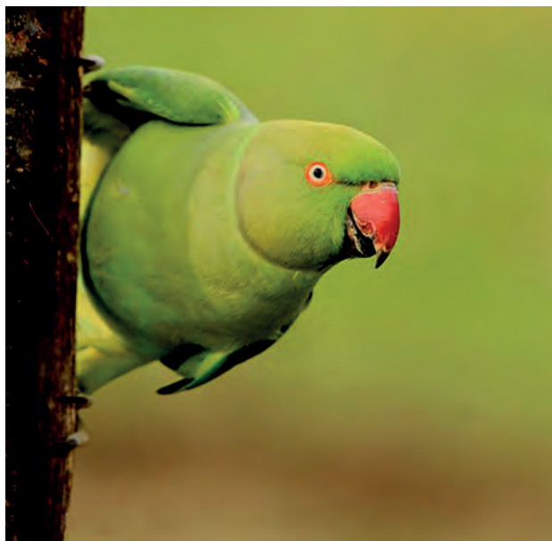
Perruche à collier

Pour accompagner ce réseau d'acteurs, le Groupe Espèces Invasives de La Réunion a été mis en place : https://www.especesinvasives.re