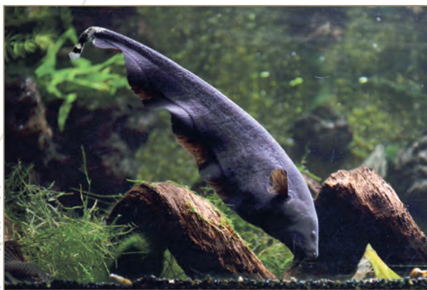
Gymnotyformes ; Apteronotus albifrons – Poisson-couteau