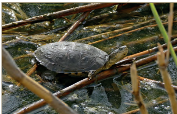
Chelonii (tortues aquatiques) ; Pelomedusa subrufa