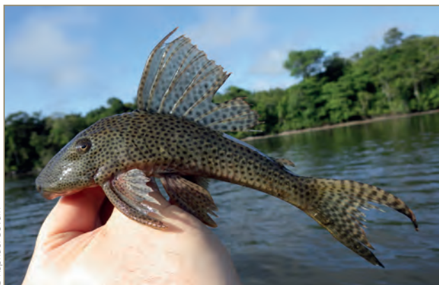
Locariidae ; Hypostomus gymnorhynchus – Pléco