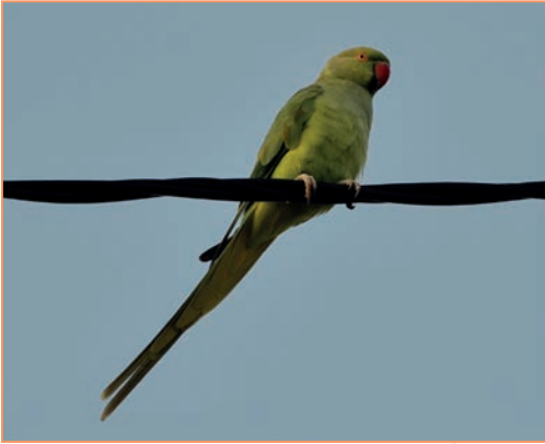
Psittacula krameri – Perruche à collier