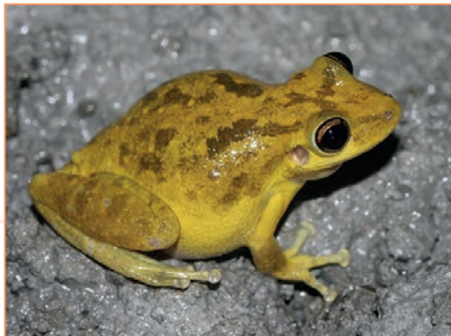
Hylidae; Scinax ruber – Rainette des maisons (mâle et femelle)