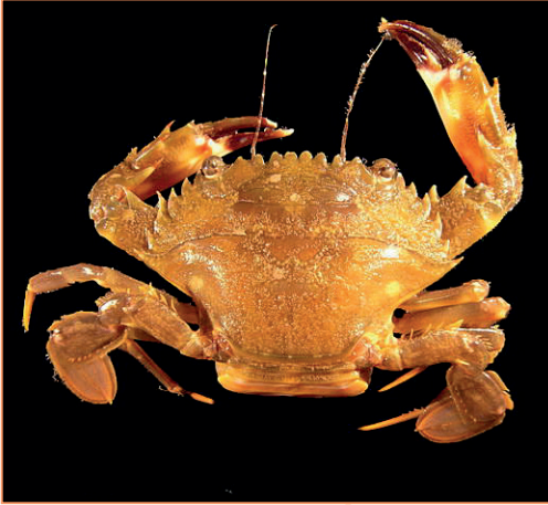
Charybdis hellerii – Crabe nageur à pinces épineuses