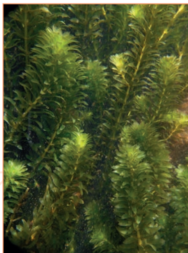
Hydrocharitaceae ; Hydrilla verticillata – Hydrille verticillée