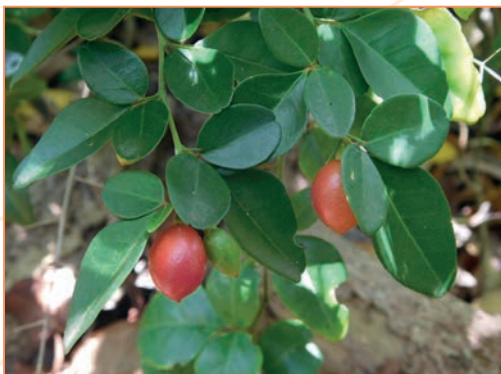
Spathodea campanulata – Tulipier du Gabon