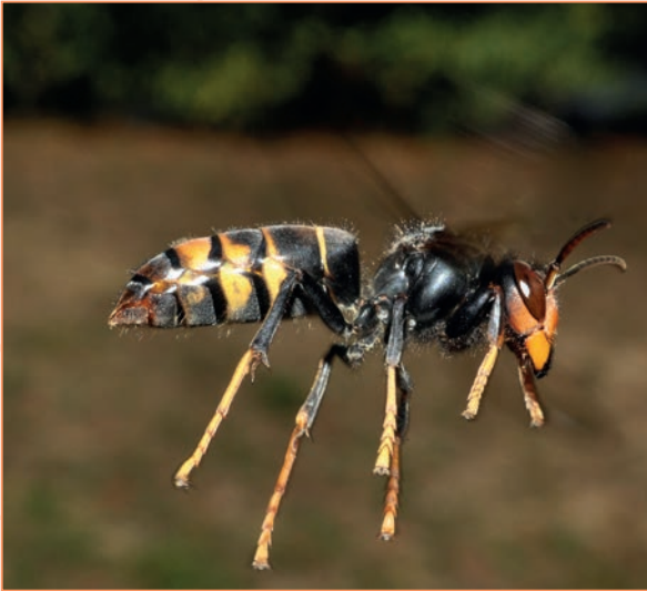
Vespa velutina nigrithorax – Frelon asiatique