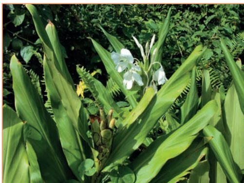
Hedychium coronarium – Hédychie couronnée