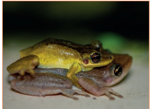
Eleutherodactylus johnstonei – Hylode de Johnstone