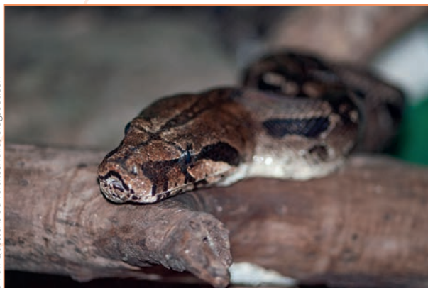
Pythonidae; Python regius – Python royal