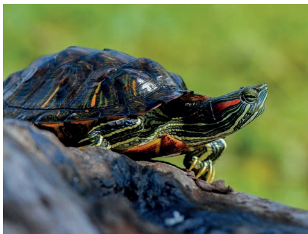
Tortue de Floride

Si vous ne souhaitez plus la détenir ou si la date de déclaration est échue, vous devez vous rapprocher de la Direction de l'alimentation, de l'agriculture et de la forêt (DAAF) http://daaf.martinique.agriculture.gouv.fr pour des éléments complémentaires et connaître les démarches à suivre.