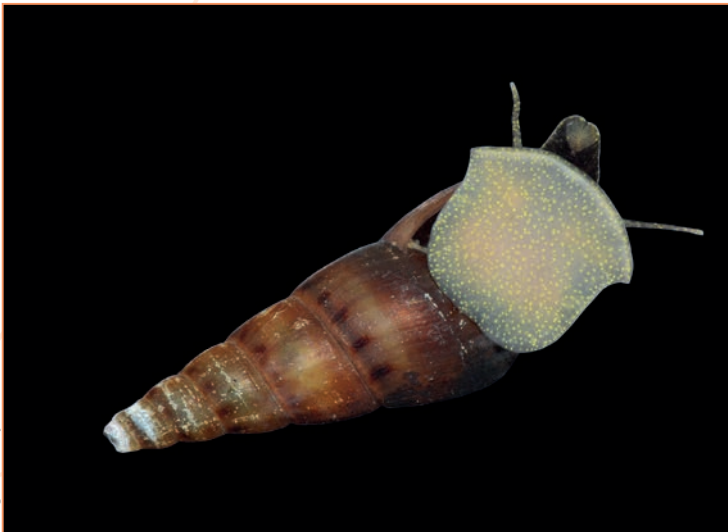
Lissachatina fulica – Achatine