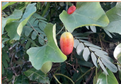
Epipremnum aureum – Pothos doré