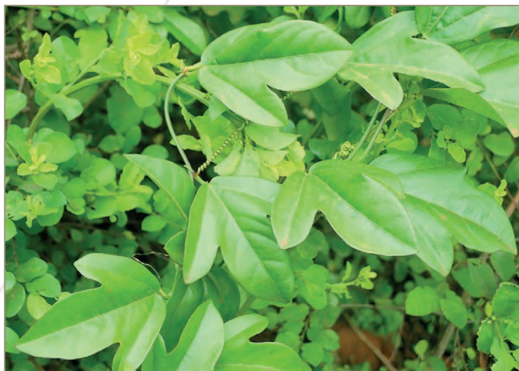
Antigonon leptopus – Antigone à pied grêle, liane corail, vahi kaburi