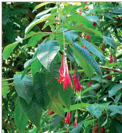
Fuchsia boliviana – Fuchsia de Bolivie, fuchsia à grandes fleurs