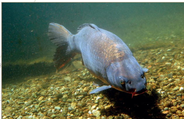
Cyprinus carpio – Carpe commune