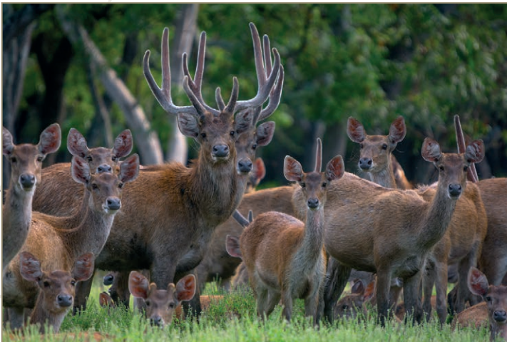
Rusa timorensis – Cerf rusa