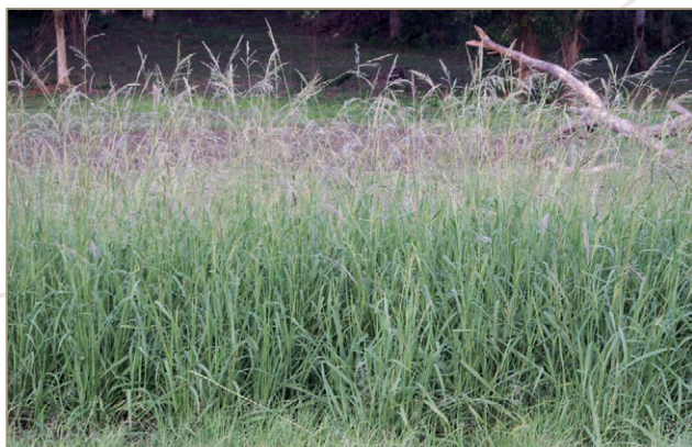
Paspalum urvillei – Paspalum d'Urville, herbe de Vasey