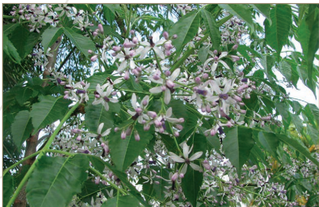
Melia azedarach – Lila, mlila