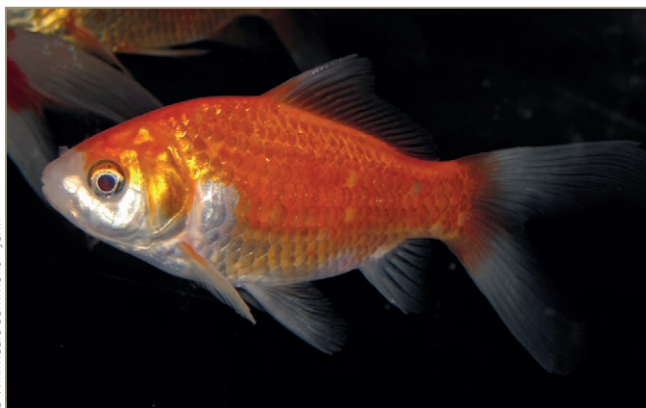
Carassius auratus – Poisson rouge