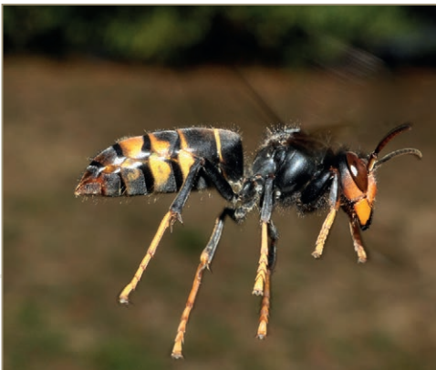
Vespa velutina nigrithorax – Frelon à pattes jaunes, frelon asiatique