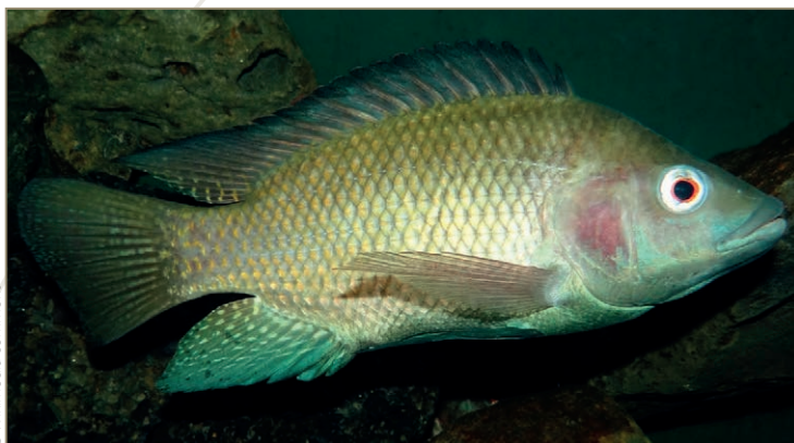
Oreochromis niloticus – Tilapia du Nil