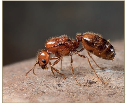
Solenopsis geminata – Fourmi de feu tropicale