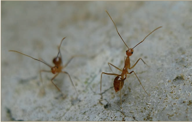
Anoplolepis gracilipes – Fourmi folle jaune