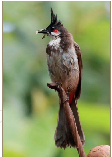
Pycnonotus jocosus – Bulbul orphée