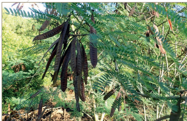
Leucaena leucocephala – Sari mugu, leucéna à têtes blanches