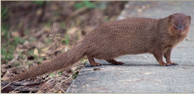
Herpestes javanicus – Mangouste de Java