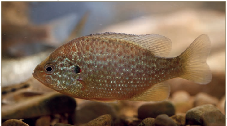
Lepomis gibbosus – Perche soleil