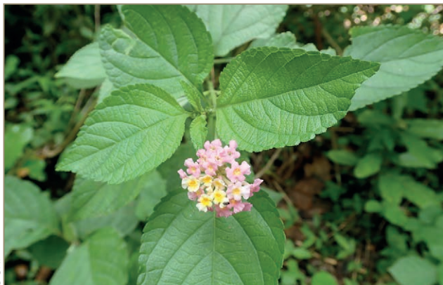
Lantana camara – Corbeille d'or, galabert, m'bwäsera