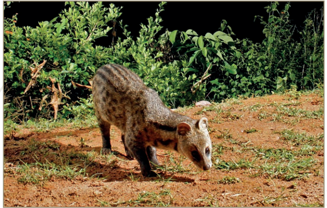
Viverricula indica – Civette indienne