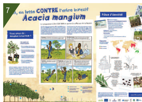
7 - Poster de sensibilisation exposé au musée de la Maison de la nature de Sinnamary.

Cette expérience de gestion complète celles des volumes 2 et 3 de l'ouvrage « Les espèces exotiques envahissantes en milieux aquatiques : connaissances pratiques et expériences de gestion », dans la collection Comprendre pour agir de l'AFB. ( https://professionnels.afbiodiversite.fr/fr/node/64 ).